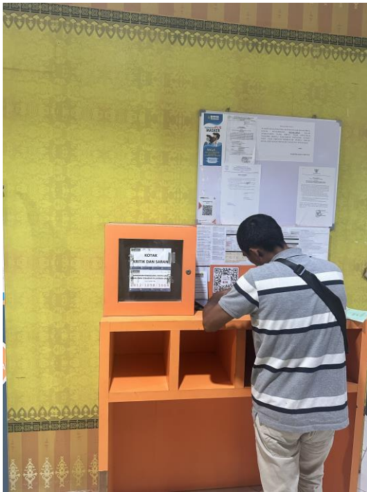
WAJIB PAJAK SEDANG MENGGISI KUESIONER